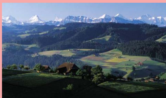
エメンタール溪谷

このチーズアイを作り出すのがプロピオン酸菌という微生物です。ある一定の温度で二酸化炭素を発生させ、出来た気泡が固まり気孔となります。世界一大きなチーズとしても有名なエメンタールですが、大きさ、形のととのったチーズアイをもつエメンタールを作り出すには微生物選び、繊細な温度管理など、熟練の技術が必要なのです。